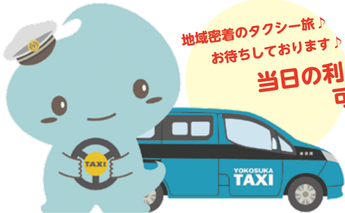
横須賀イメージキャラクター「スカリン」