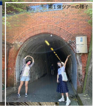
第1弾ツアーの様子

※上記ツアーコースは都合により急遽、変更させていただく場合がございます。 ※状況によりトンネルに入れない場合、コースを一部変更させていただく場合がございます。 ※ミニ講座は、新型コロナウイルスの感染状況などにより、中止もしくは短縮することがあります。 ※全行程、徒歩での移動になります。食事は含みません。