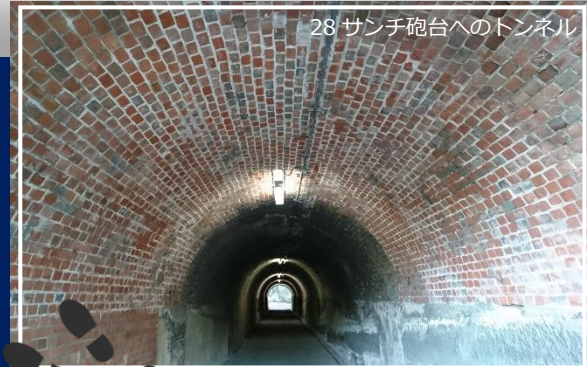
28 サンチ砲台へのトンネル

全国のトンネルを歩き「マツコの知らない世界」などメディアで情報発信中。各地でトンネルツアーも実施。今春、総務省地域力創造アドバイザーに就任し、トンネルなど地域コンテンツの磨き上げにも取り組む。