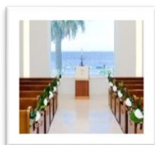
観音崎京急ホテル