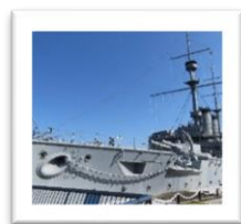
世界三大 記念艦「三笠」