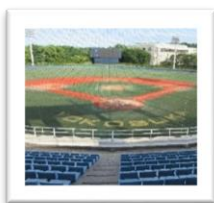
横須賀 スタジアム