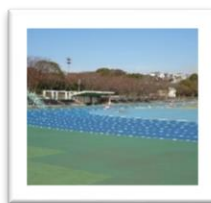
不入斗 陸上競技場