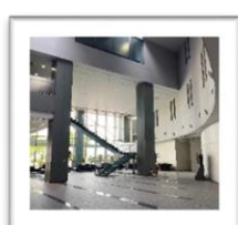
YRP センター 1 番館