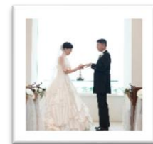
観音崎京急ホテル チャペル

横須賀ウェディングフォトトリップは、 一般社団法人横須賀市観光協会と チアーズブライダルの共同事業です。