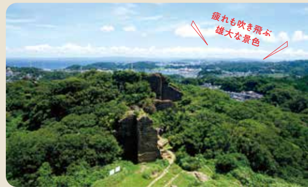
疲れも吹き飛ばす 雄大な景色