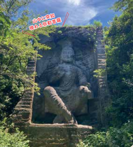
山中に突如 現れる弥勒菩薩