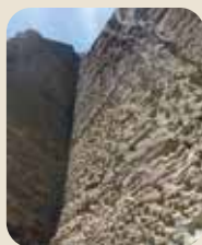
(上) 岩肌の穴はロッククライミングの練習で打ち込まれたハーケン(ハケ)の跡。(右) 桜やツツジの名所でもある。