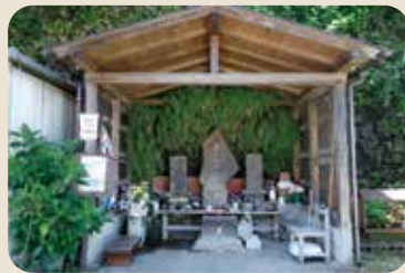
お堂前の山裾の道は「浦賀みち」の面影を残す。