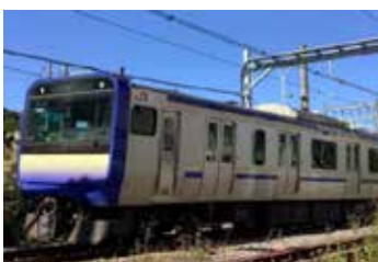
横須賀線 E235 系

※整理券の配布はございません。グリーン車の休憩スペースは、混雑状況によりお待ちいただく場合がございます。