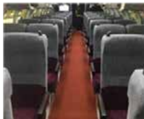
E235 系 グリーン車(車内)