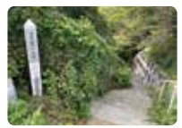
「浦賀道」と書かれた細い階段を下る。