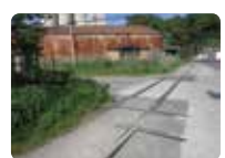
旧海軍軍需部の倉庫群に物資を運搬するために利用された、引き込み線の跡が残る。

景德寺境内に祀られていた速玉之男命と大山咋命が、明治3(1870)年に神仏分離によりこの地に移され独立した。