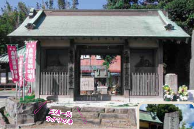
三浦一族 ゆかりの寺

参道正面にある仁王門。右に「三浦富士権現」、左に「七宝山東光寺」の標示板を掲げている。